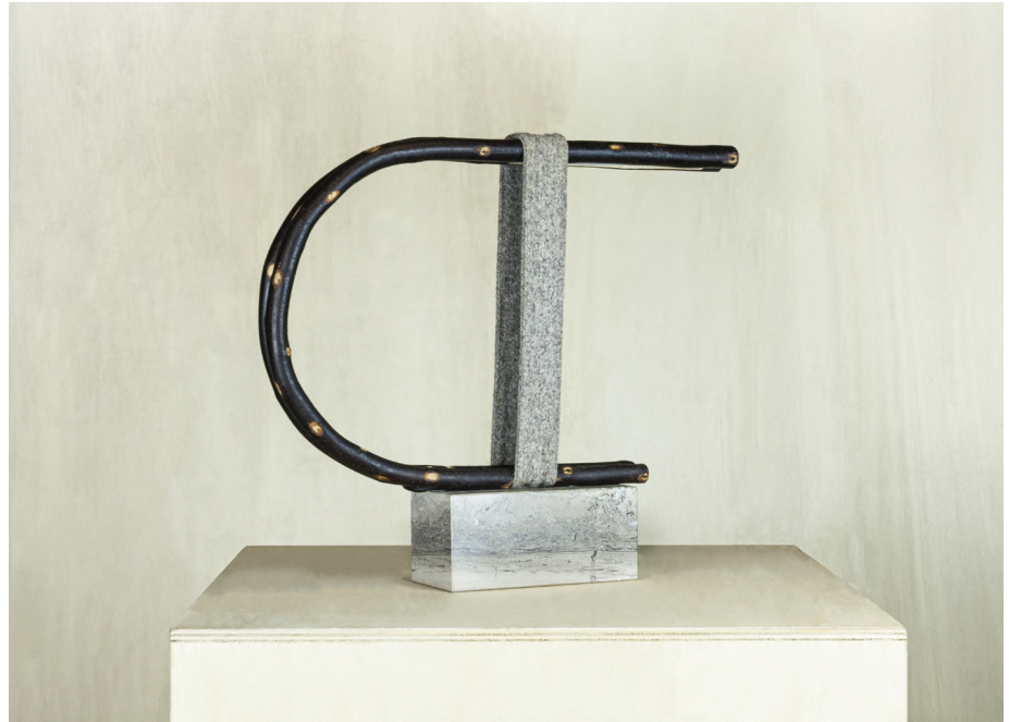
Table basse Vernaculaire